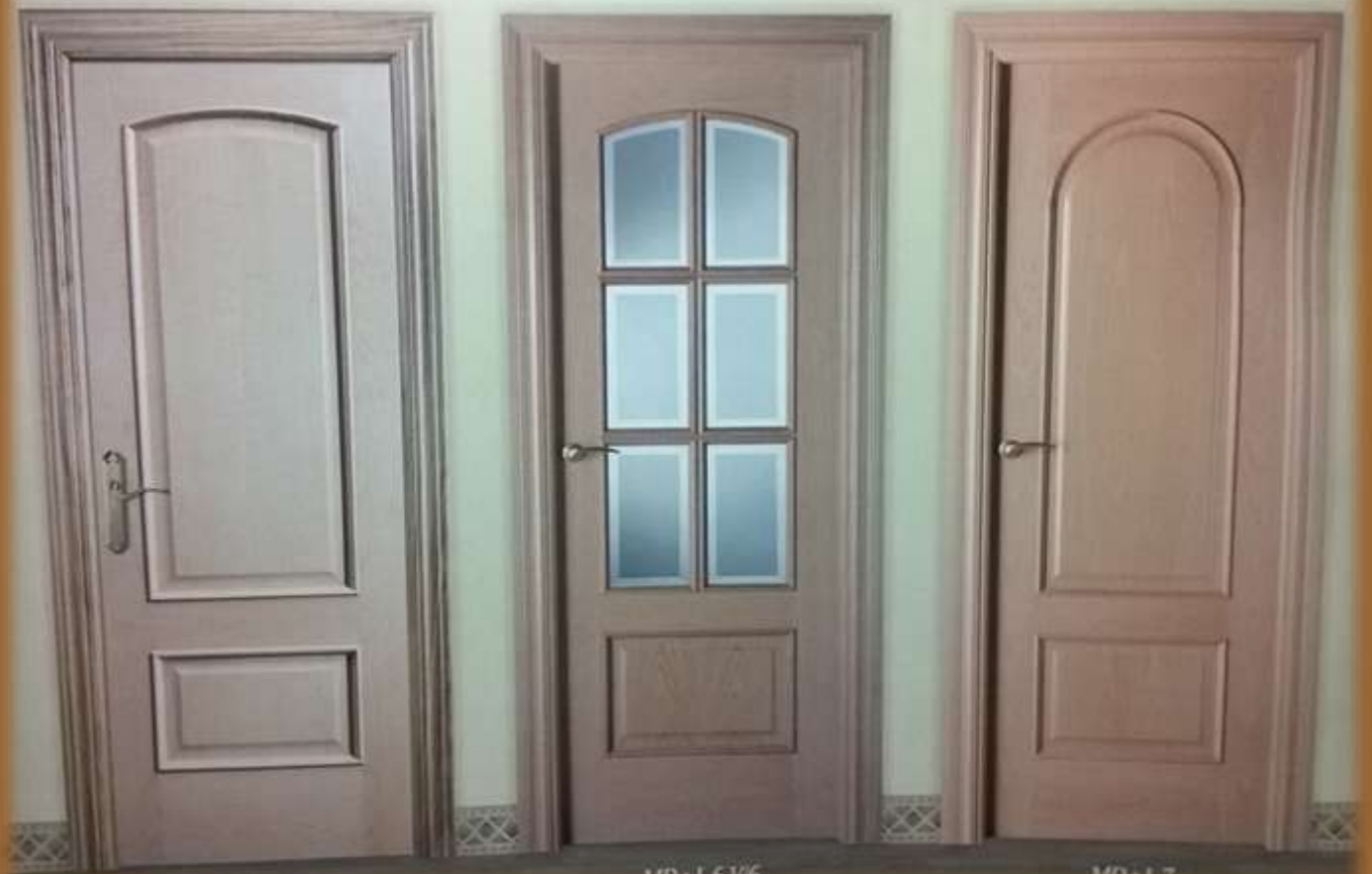
Puertas de interior laminadas serie clásicas