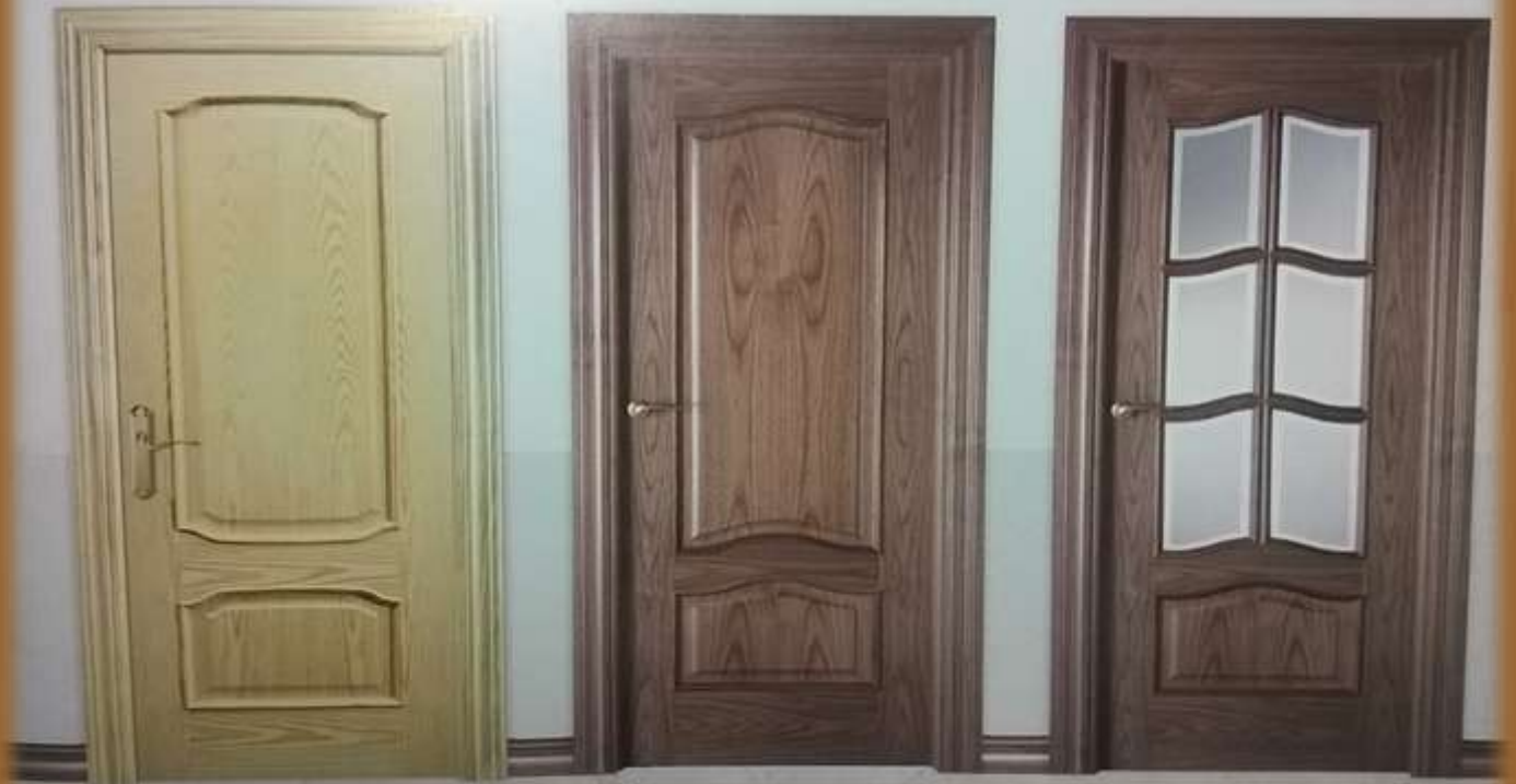
Puertas de interior laminadas serie clásicas